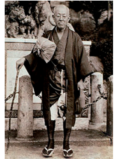
学校再興のために全国巡歴される 恩田重信先生

学校法人明治薬科大学経営の最大の特徴は恩田先生のこの言葉を継承した「維持員制度」にあります。本学寄附行為施行規則 第18条では、「維持員は、人格、識見ともに卓越し、物・心両面からこの法人の経営に参画し、法人の将来の発展に寄与するものとする。」と定めています。全国の維持員の中から、選挙を通じて評議員を選出し、さらにその評議員から理事を選任して、その理事が学校法人の経営にあたるのです。