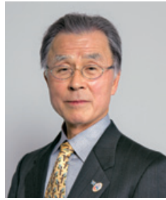
学校法人明治薬科大学 第11代理事長