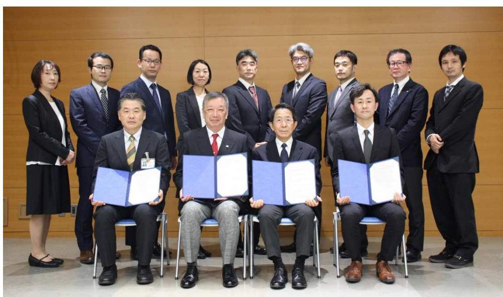
連携研究センター設立キックオフミーティングの様子 (撮影時のみマスクを外しています)